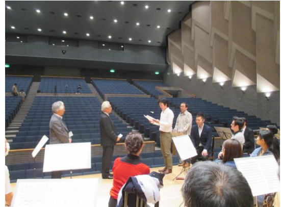
音楽家ユニオン所属団員からの受領式