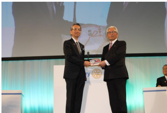
国際ロータリー地区大会における受領式