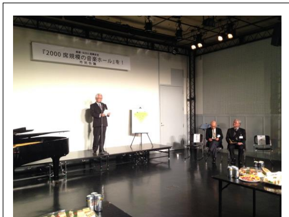
賛同者交流会 代表世話人挨拶

交流会では、それまでの活動経過を映像等で報告するとともに、これまで顔を合わせる事が無かった賛同者同士が、有志による演奏などもまじえながら楽しく交流し、今後の活動の成功を祈った。