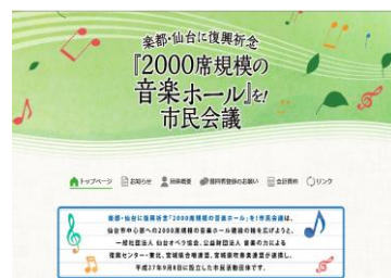
市民会議ホームページ

メールアドレスを登録いただいた賛同者には、メーリングリストにより市民会議の活動内容やイベントの情報を記載したメールマガジンを随時お届けしている。