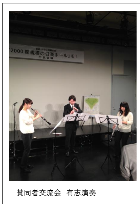
賛同者交流会 有志演奏