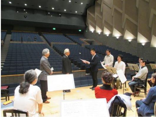
仙台フィル楽団員からの受領式