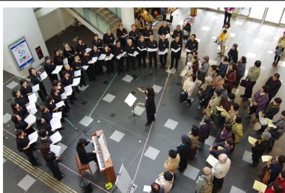
第1回街なかコンサート