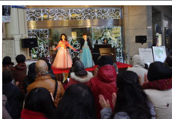
第2回街なかコンサート