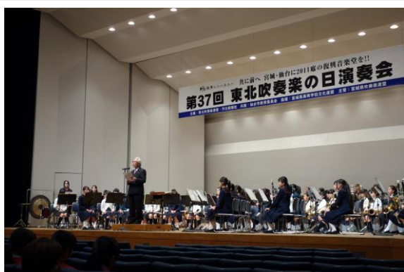
第3回街なかコンサート